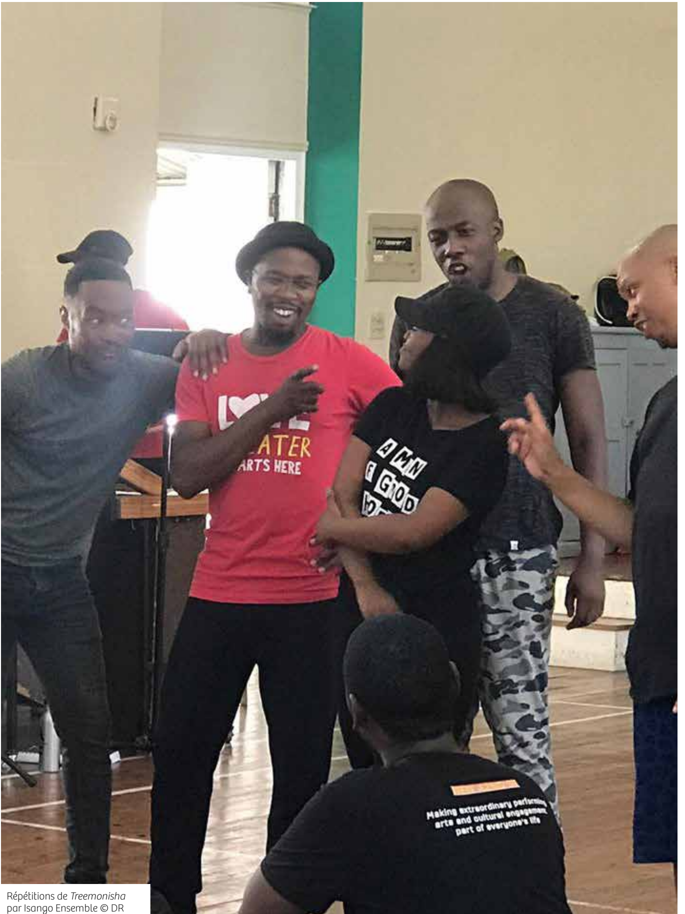
Répétitions de Treemonisha par Isango Ensemble