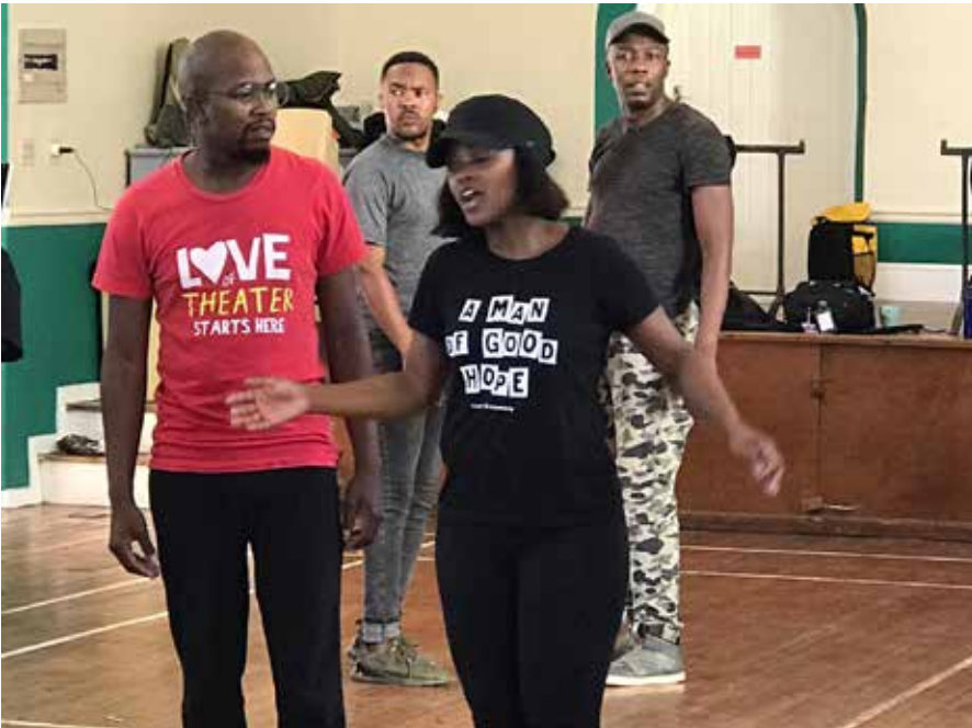
Répétitions de Treemonisha par Isango Ensemble