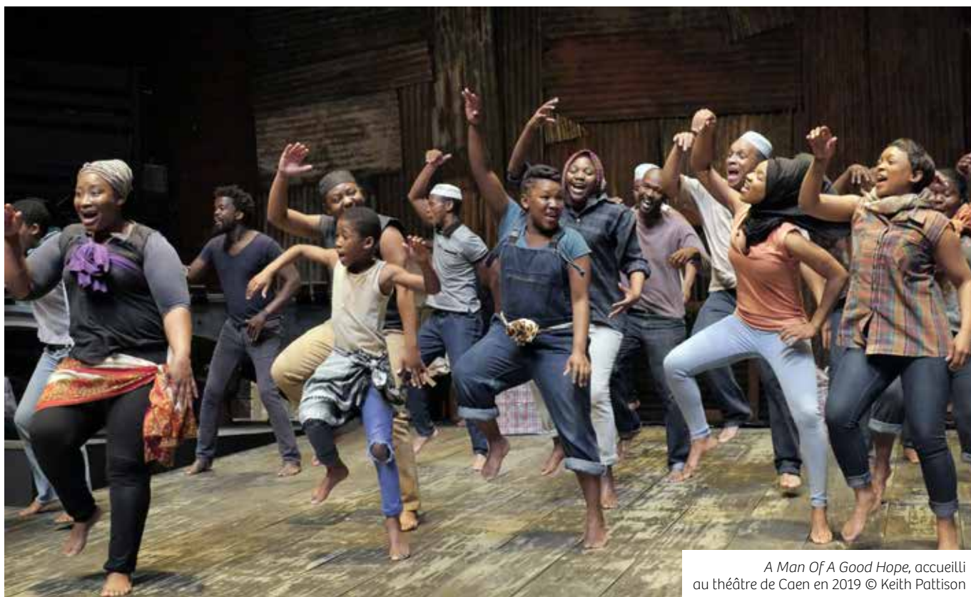
A Man Of A Good Hope , accueilli au théâtre de Caen en 2019

La compagnie sud-africaine Isango Ensemble est basée à Cape Town. Formée en 2000, la compagnie se compose essentiellement d'artistes originaires des townships des alentours. Elle accueille des artistes à toutes les étapes de leur carrière, permettant aux plus expérimentés de diriger et de contribuer à l'accompagnement des jeunes talents. Au sein de la compagnie, se trouvent des interprètes aux compétences variées.