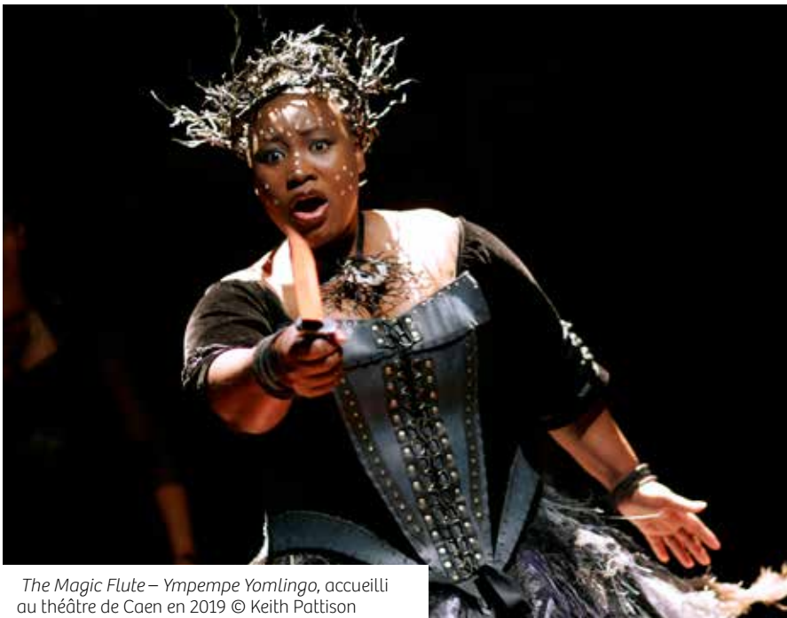
The Magic Flute – Ympempe Yomlingo, accueilli au théâtre de Caen en 2019