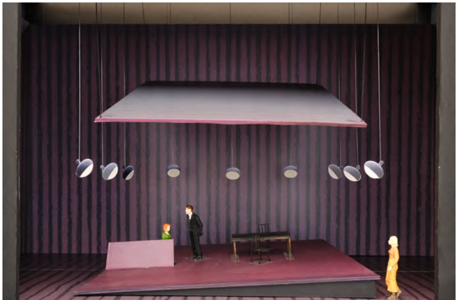
Images du projet scénographique