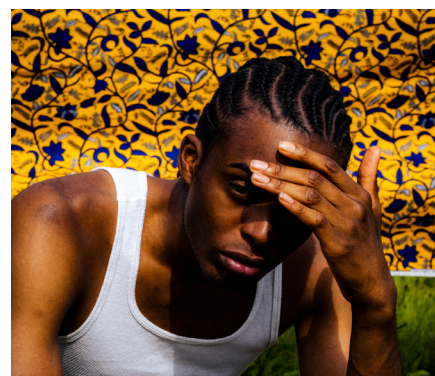
Kashama © Anastasia Polak