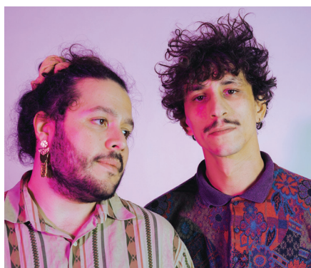
Olkan et la Vipère Rouge © Juliette Valero