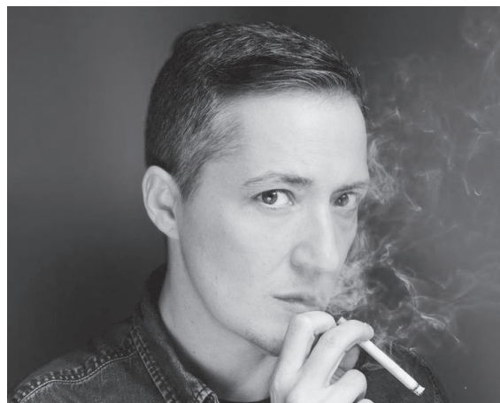
PAUL B. PRECIADO

Le travail d'Anne Pauly mêle plusieurs territoires d'écriture : l'intime, l'émotion, le cocasse, la collusion des univers fictionnels, mais aussi les univers de la contre-culture et du déclassement.