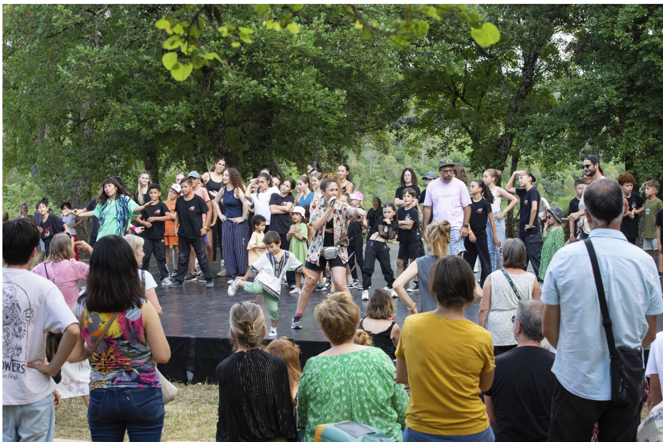
1 km de danse, Uzès