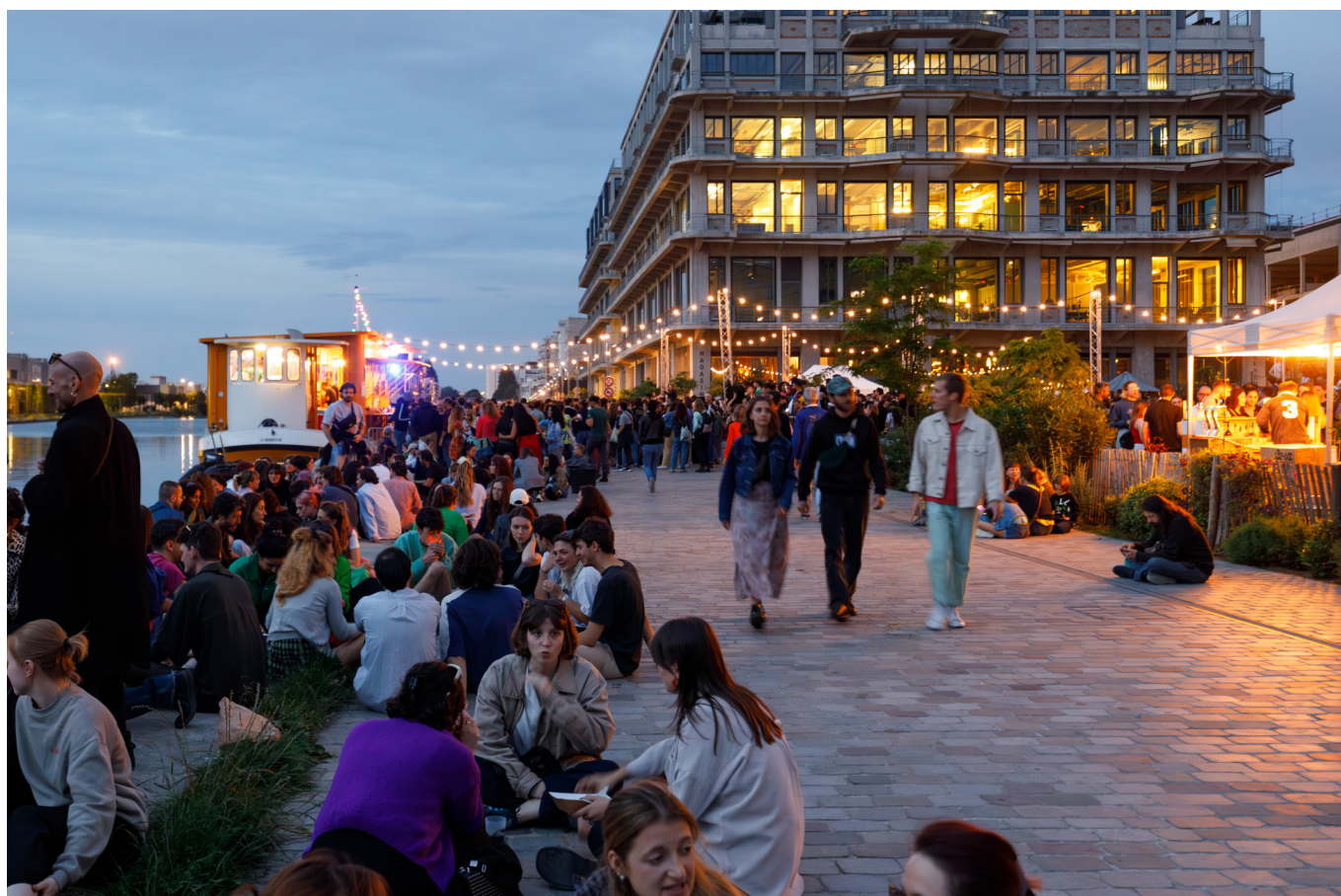
1 km de danse , 2023, CND Centre national de la danse