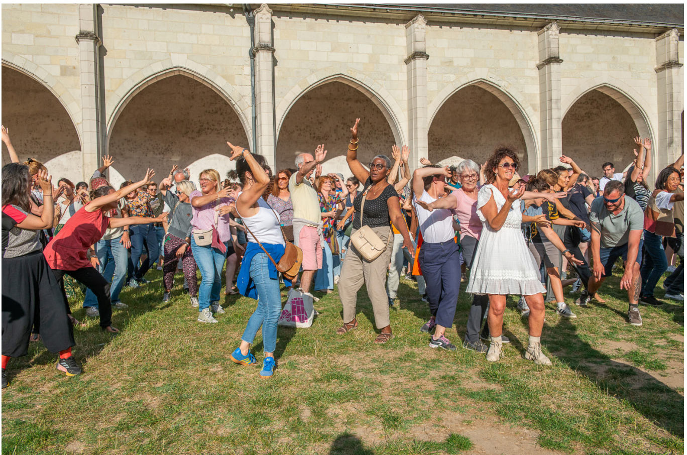
1 km de danse, CCNO