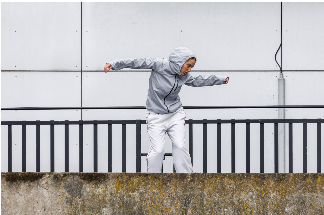
1 km de danse , 2025, CND Centre national de la danse