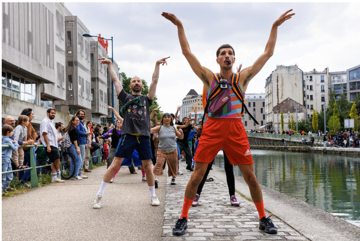
1 km de danse 2025, CND Centre national de la danse