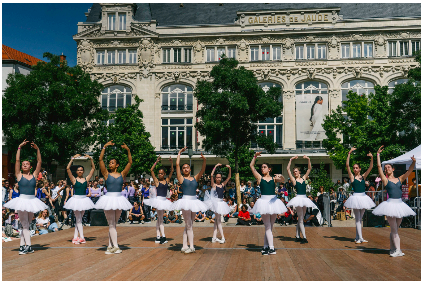
1 km de danse, 2025, Clermont Ferrand