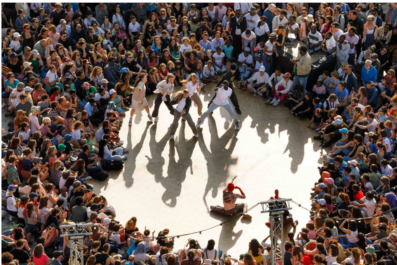
1 km de danse, 2023, CND Centre national de la danse